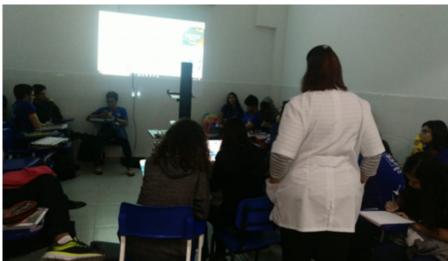
Figura 1. Orientação para a produção do Mapa Mental Colaborativo

Na turma escolhida como objeto de estudo (uma turma de 3º ano do ensino médio) a metodologia da educação híbrida utilizada foi, especificamente, a “Sala de aula invertida”. Os alunos tiveram de se preparar, com os conteúdos postados em um AVA (Ambiente Virtual de Aprendizagem), para a conclusão da atividade que seriam executadas posteriormente de forma presencial. A atividade de finalização foi a elaboração de um Mapa Mental Colaborativo, utilizando a plataforma “GoConqr”. Esses foram debatidos junto a classe e utilizados para fazer a produção textual requerida na disciplina. Fazendo o fechamento da aula aplicando um questionário avaliativo sobre a metodologia aplicada, disponibilizado no link : < https://goo.gl/forms/9XP0qT1Bw8bFOGj03 >. Seguem alguns registros: