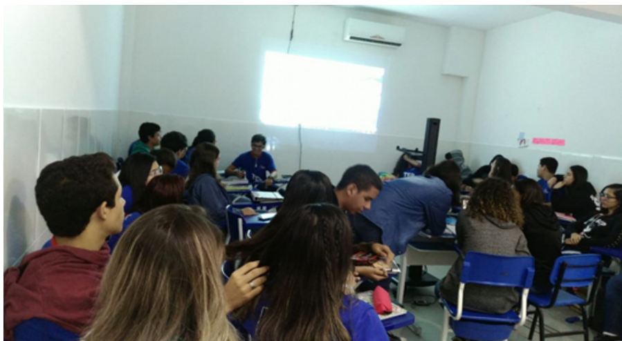
Figura 2. Momento de produção coletiva do Mapa Mental Colaborativo