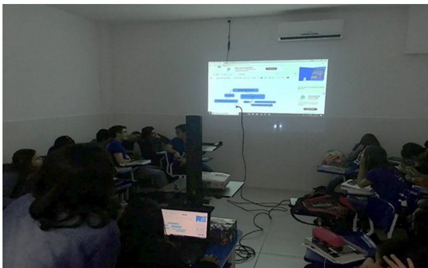
Figura 5. Inserção de informações no Mapa Mental Colaborativo