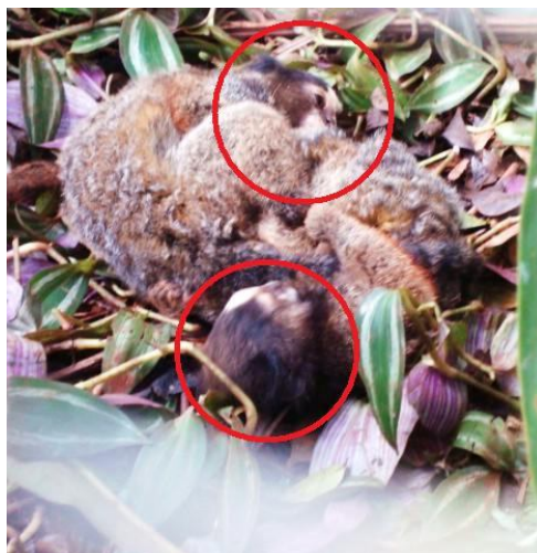
Fig. 03. Comportamento de brincadeira "Luta romana" entre dois saguis jovens, descrito por Stevenson & Rylands , 1988.

Na Fig. 03, pode-se perceber como ocorriam as "lutas romanas": na maioria das vezes, quando um indivíduo fica em posição oposta ao outro e ocorrem diversos empurrões e repuxos. Também, em conjunto com este comportamento, foram observadas brincadeiras como as de beliscar/morder.