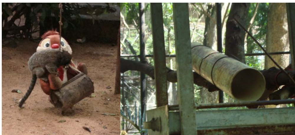
Figs. 01 e 02: Interação do indivíduo com o urso de pelúcia. À direita, demonstração de objetos dispostos no recinto.

“Esconde-esconde” teve uma frequência de 3%, muito inferior aos outros comportamentos executados. Esta brincadeira foi observada geralmente em conjunto com comportamentos de locomoção e seguida por outra atividade de brincadeira. Comportamentos classificados como “luta romana”, expressões faciais e corridas pelo recinto foram registrados com uma frequência