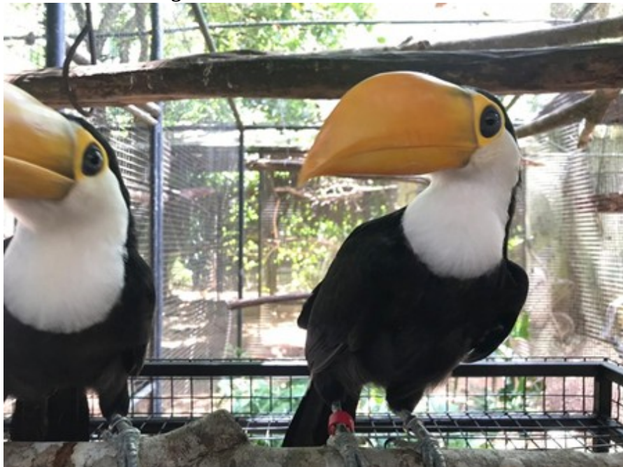
Figura 2. Tucanos com 80 dias de vida.

O quadro abaixo descreve, ainda, as características principais na mudança física no desenvolvimento dos filhotes de acordo com os dias de vida, como também, a média do peso que eles atingiram sob cuidados humanos.