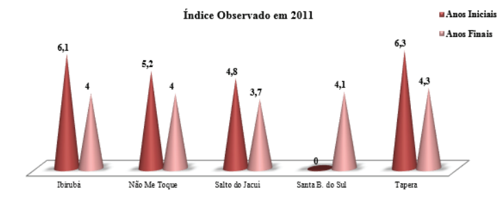
Gráfico 02: Índice Observado em 2011