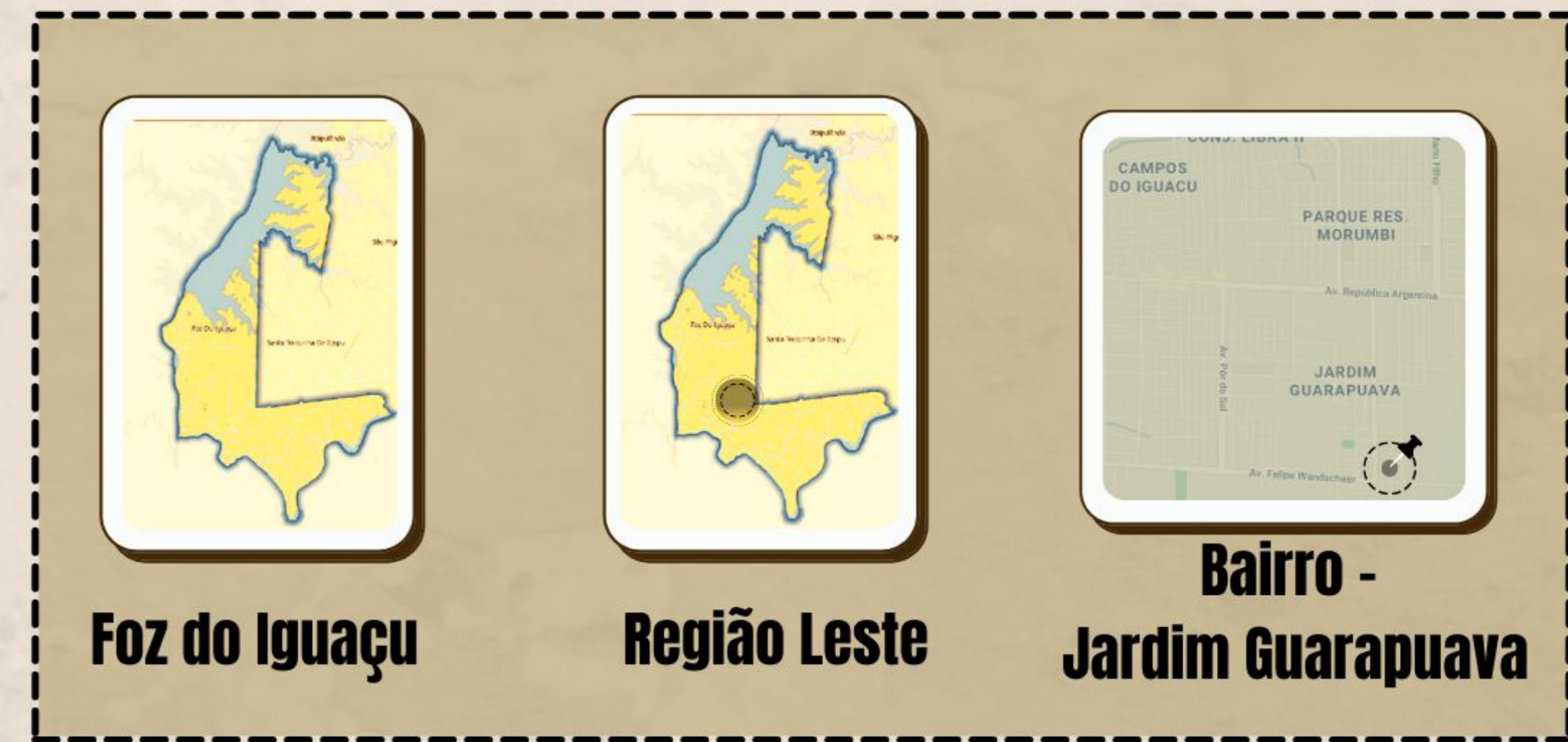
Foz do Iguaçu