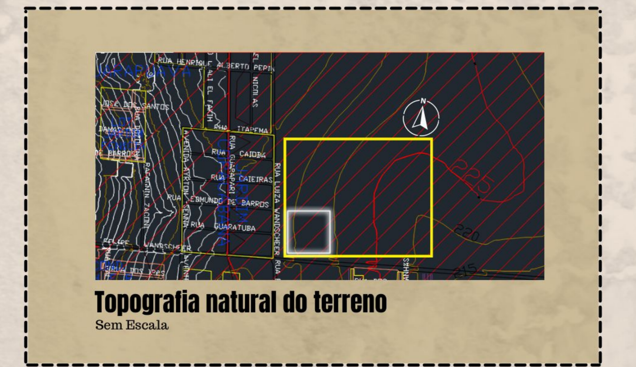
Topografia natural do terreno Sem Escala.