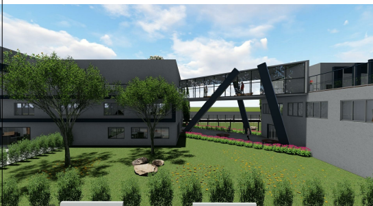
IMAGEM CONEXÃO BLOCO ENSINO MÉDIO E BLOCO ARTÍSTICO E DE PESQUISA, ATRAVÉS DE PASSARELA

A ÁREA DE CONVÍVIO ESTÁ ALINHADA COM O PONTO FOCAL DO MURAL MEMORIAL PROPORCIONANDO AOS ALUNOS A INTEGRAÇÃO COM O ELEMENTO.