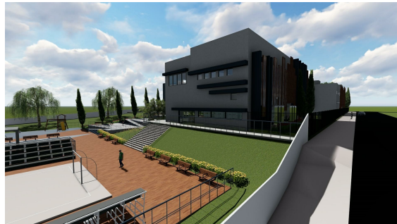
VISTA BLOCO ARTÍSTICO E DE PESQUISA