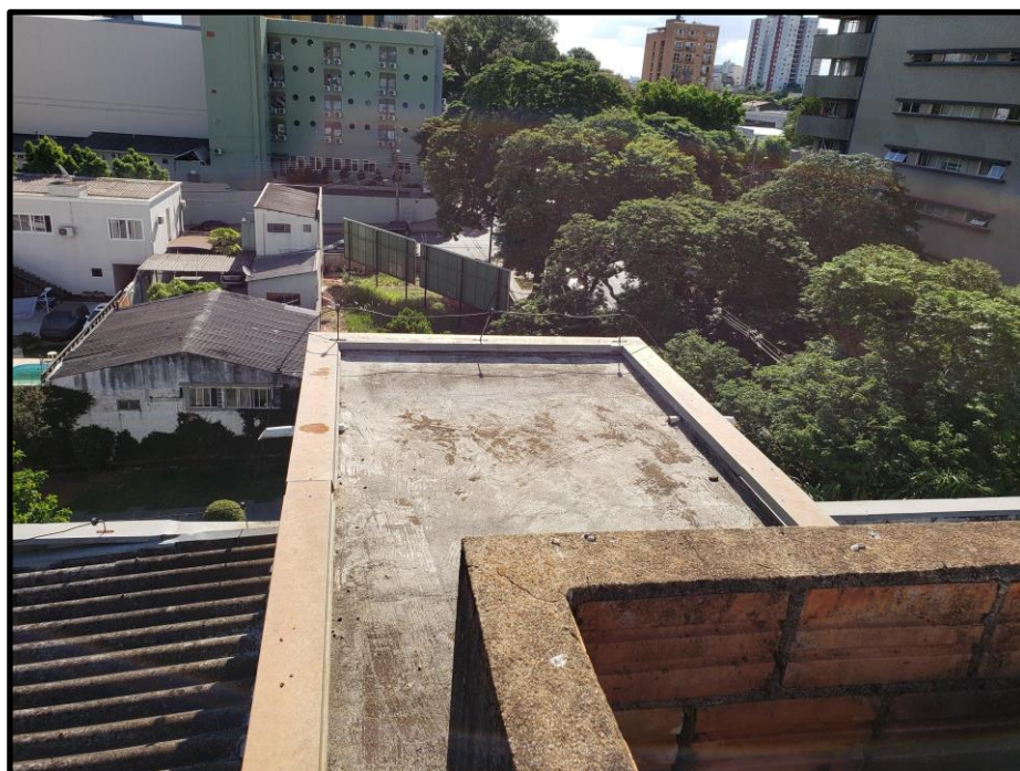
Imagem - Espaçadores e malha SPDA.